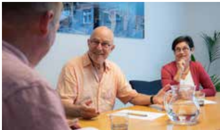
Konversationskurs für Senioren

Jedes Jahr schwerfälliger werden muss nicht sein... Fremdsprachen lernen ist erwiesenermassen ein ideales «Hirnjogging» und wirkt stark präventiv gegen Demenz. Üben Sie gemeinsam und regelmässig in einer sympathischen Kleingruppe und bleiben Sie mental fit!