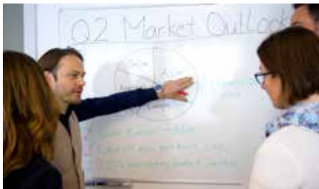
Firmenkurs beim Kunden

Sie sind Firmeninhaber und möchten sich selber oder Ihr Team fit für die internationale Kundschaft machen? Dann brauchen Sie nicht mal zu uns in die alte Weberei zu kommen. Bei adäquater Einrichtung unterrichten wir direkt bei Ihnen im Sitzungszimmer!